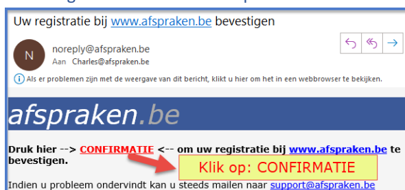
Fig 3: In de email klikt u op CONFIRMATIE

U zal een email ontvangen van www.afspraken.be .